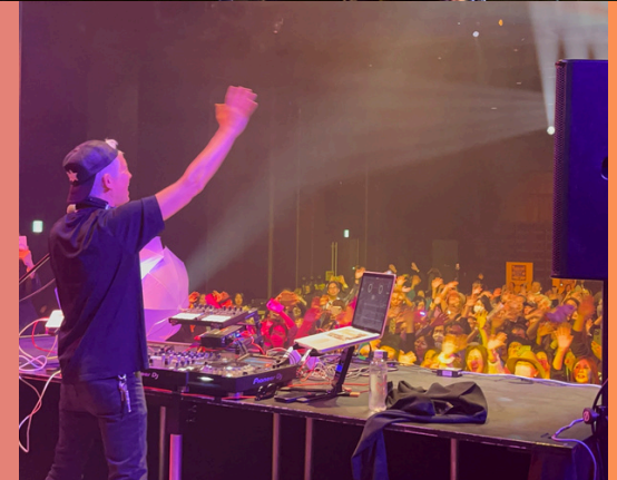
熊本城ホール開業5周年記念のスペシャルゲスト! マーク・パンサー氏 (globe)